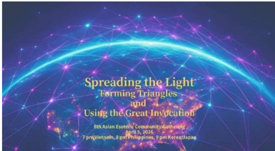
Póster del 8º Encuentro de la Comunidad Esotérica Asiática