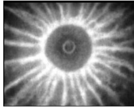
Ejection de plasma depuis le centre stellaire.