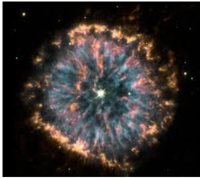
Nébuleuse de l'Œil étincelant NGC 6751